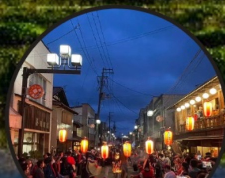
Night Market 夜市