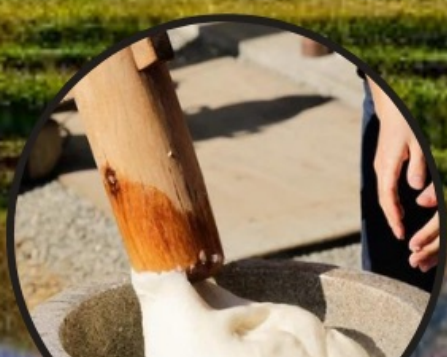
Mochi pounding 餅つき