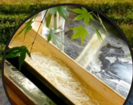
Flowing Noodles 流しそうめん