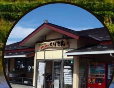
Merchant Town 商店街