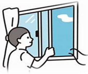
換気 (定期的な換気)